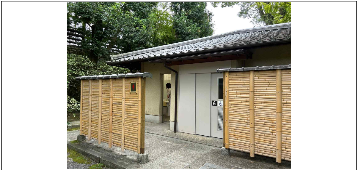
② 일본 리쓰린 공원의 상공장려관