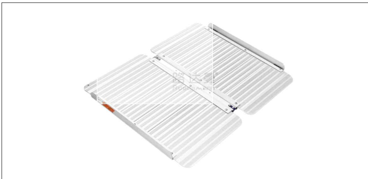
[그림 V-7] 이동식 경사로의 예