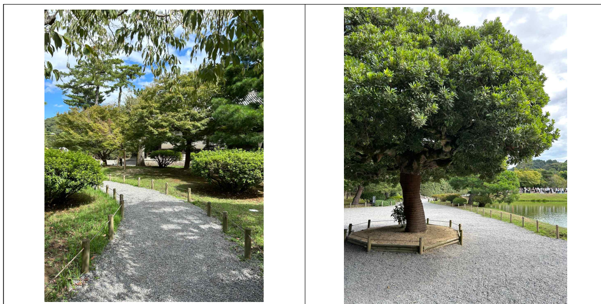
[그림 V-3] 장애인들의 이용이 가능한 화장실