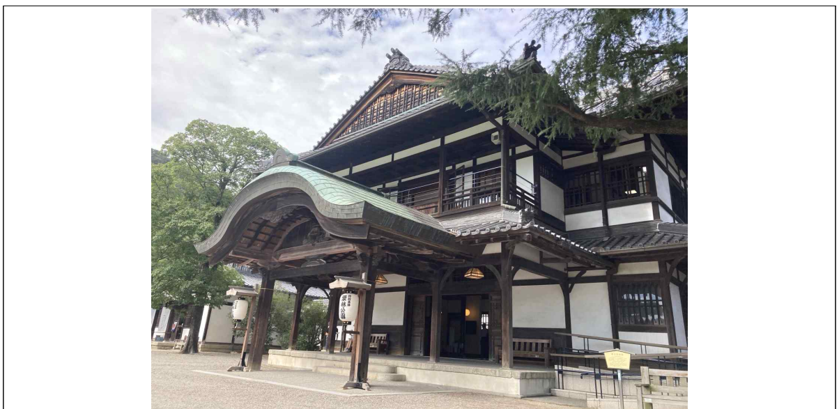
[그림 V-5] 상공장려관 입구의 경사로